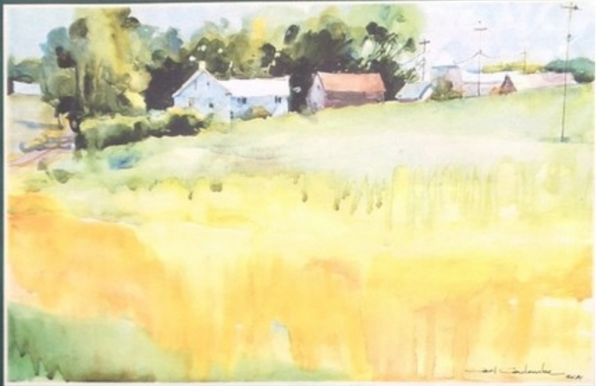
Dignon Hill, 10 x 15

Est-il nécessaire de dire que la démarche de cet artiste est véritablement conditionnée par la seule pensée de nouvelles expériences et d'échanges renouvelés avec des gens qui partagent cette même passion ?